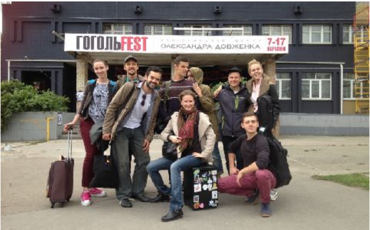
GOGOLFEST SEPTIEMBRE 2017